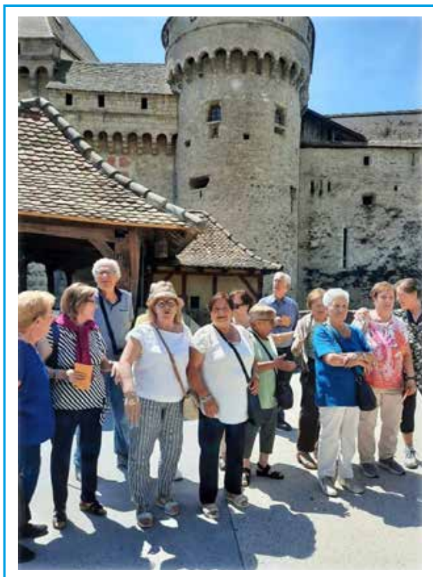
Giugno 2023 / MCLI – Biel-Bienne