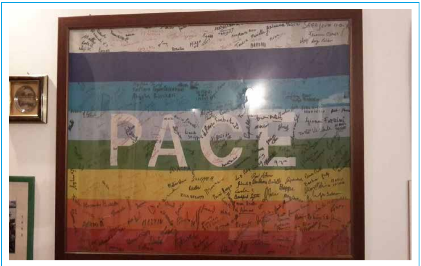
Bandiera della pace firmata da tutti i partecipanti all'ultima Marcia della Pace di don Tonino a Sarajevo nel 1992