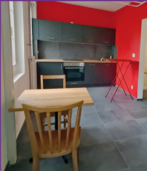
Blick in einen renovierten Raum im Jugend- und Gemeindehaus.