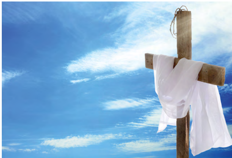
Il est ressuscité!