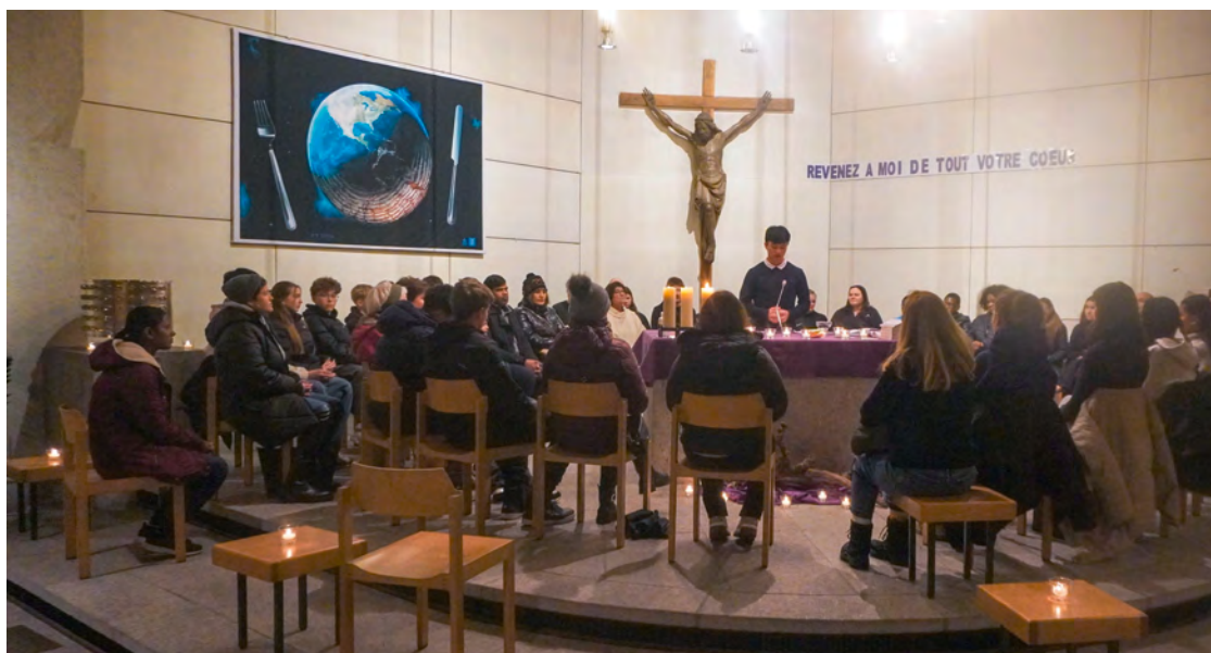
Jugend und ihr Gottesdienst im Bruder Klaus.