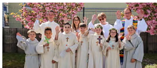
Erstkommunikanten 2024.