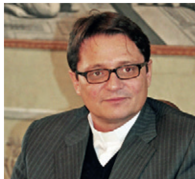
Mgr Felix Gmür

Le Vatican propose de préparer le Synode des évêques de 2023 en trois phases. Un processus qui a débuté en octobre dans les diocèses et qui implique l'ensemble des fidèles. L'évêque diocé- sain, Mgr Felix Gmür, s'en réjouit tout particuliè- rement: