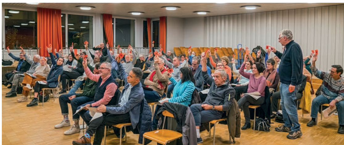
Die Kirchgemeindeversammlung stimmt über das Budeget 2024 ab.