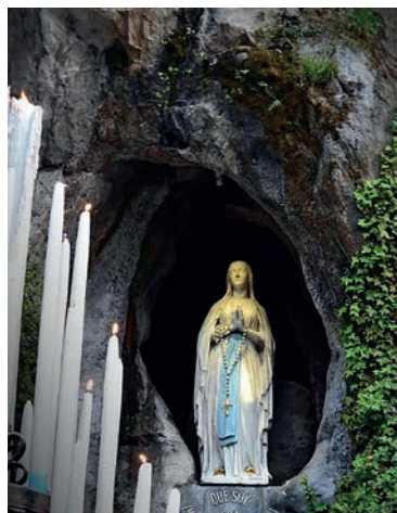
Grotte de Lourdes.

Tous les samedis à 18.30, salle St-Joseph de l'église Ste-Marie, réparation au Cœur Immaculé de Marie, en français et portugais.