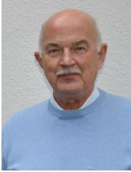
Michel Conus, président du Synode puis du Parlement de l'Église nationale à partir de 2019.