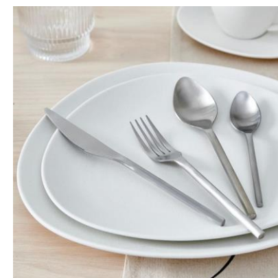
TAVOLA FRATERNA 2023/2024

Le persone interessate sono gentilmente pregate di annunciarsi alla segreteria il venerdì che precede la data prescelta.