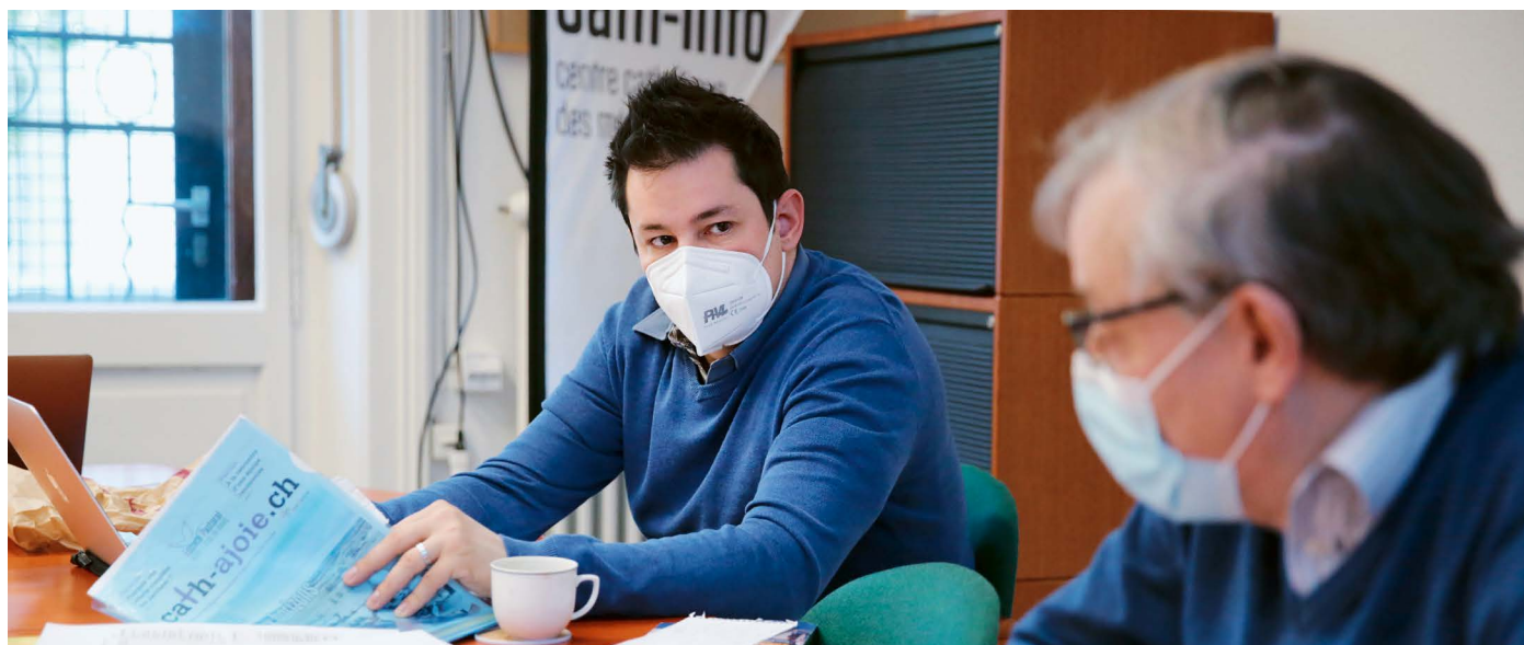
La rédaction à l'heure du briefing