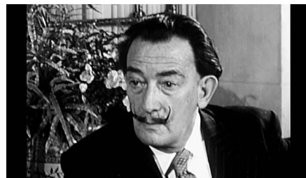
Le «divin» Dali (1904-1989)

Pourquoi ce libre-penseur, peintre génial et provocant, est-il revenu à la religion de son enfance? Pourquoi le «divin» Dali considérait-il Jésus comme du fromage coulant? Comment inter-